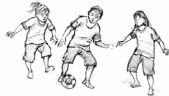
កាលនៅអាយុ ៥ ឆ្នាំ