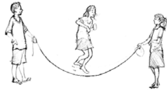
កាលនៅអាយុ ៥ ឆ្នាំ